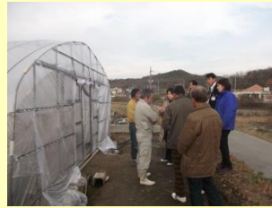
先進地で意見交換