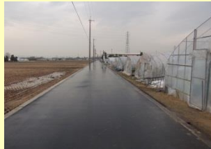
広陵のハウスと周辺