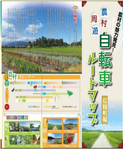
農村を周遊する自転車ルートをPR

四季折々に変化する農村の風景や風土をのんびり五感で楽しめる自転車周遊ルートを提案しています。