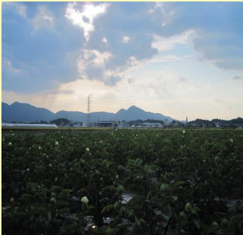
綿花の栽培風景と二上山