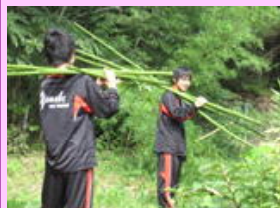
学校の演習林で竹を伐採