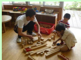
5歳児クラスで積み木遊び