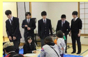
科学マジックショー