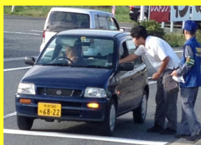
交通安全啓発活動