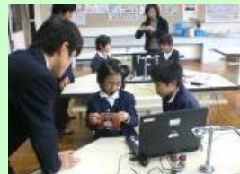
ロボットのプログラミング体験