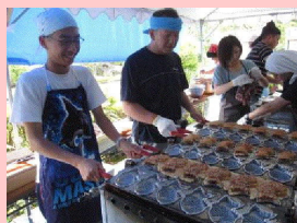
屋台で鯛焼きの販売