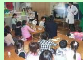
科学で料理「お菓子を作る」