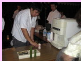
調理室で竹ようかんの制作