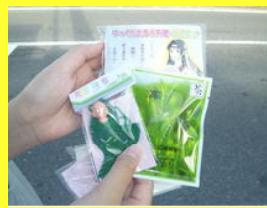
キュウピー人形と