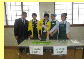
本校の緑茶や入浴茶の販売