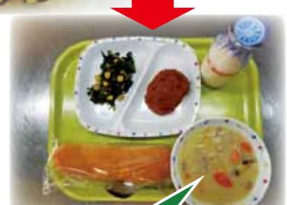
カットさつまいもを使用したシチュー