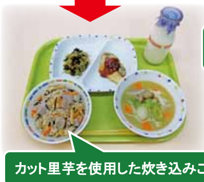
カット里芋を使用した炊き込みご飯