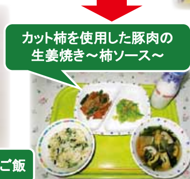
カット柿を使用した豚肉の生姜焼き～柿ソース～