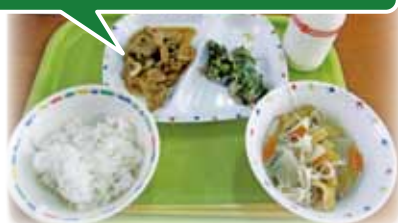
奈良漬を使用した豚肉の生姜焼き