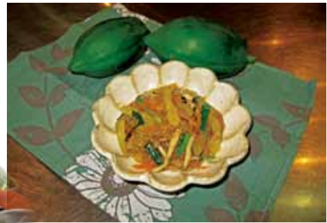
青パパイヤのチャフチェ

【12月1日】青パパイヤの収穫を受けて、学校給食に取り入れられるようなメニュー開発と調理実習を実施した。