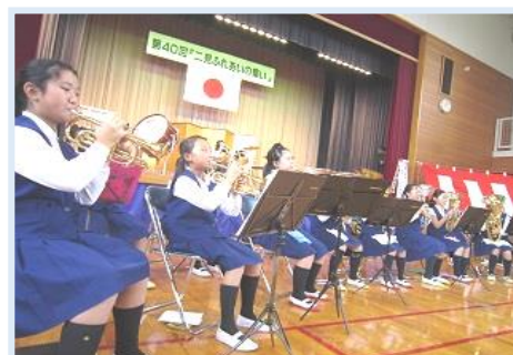
五條小金管バンド