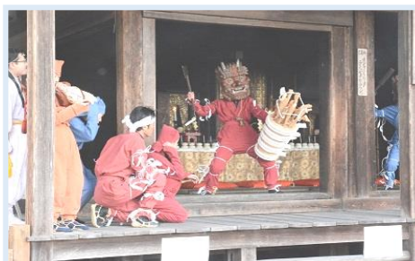
阪合部子ども鬼はしり