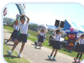
五條小五夢りんキッズダンサーズ