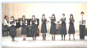
五條高コーラス部・吹奏楽部