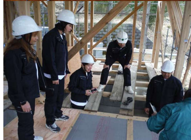
タイ留学生の受け入れ