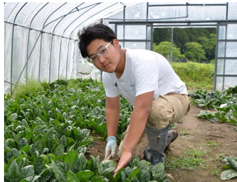
地域おこし協力隊