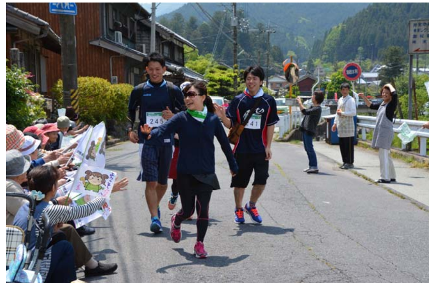
やまと姫マラソン 参加者300名