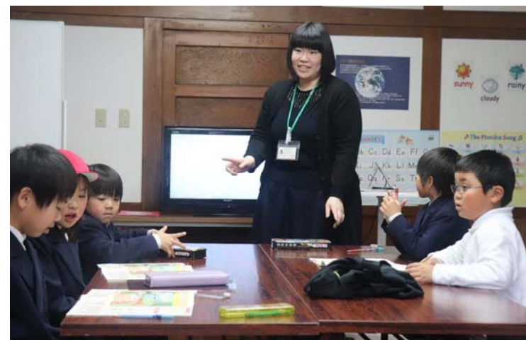
グローバル人材育成塾 小中学生対象 英語