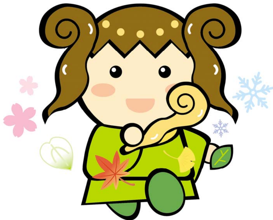
御杖村の「つえみちゃん」