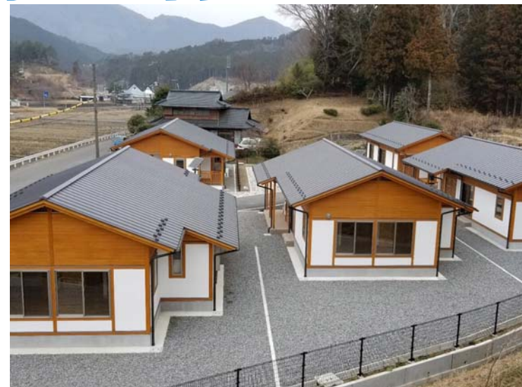
地域優良賃貸住宅 5棟完成