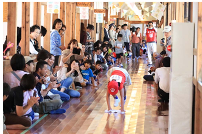
ザ！雑巾ダッシュ！！ 2019 in みつえ