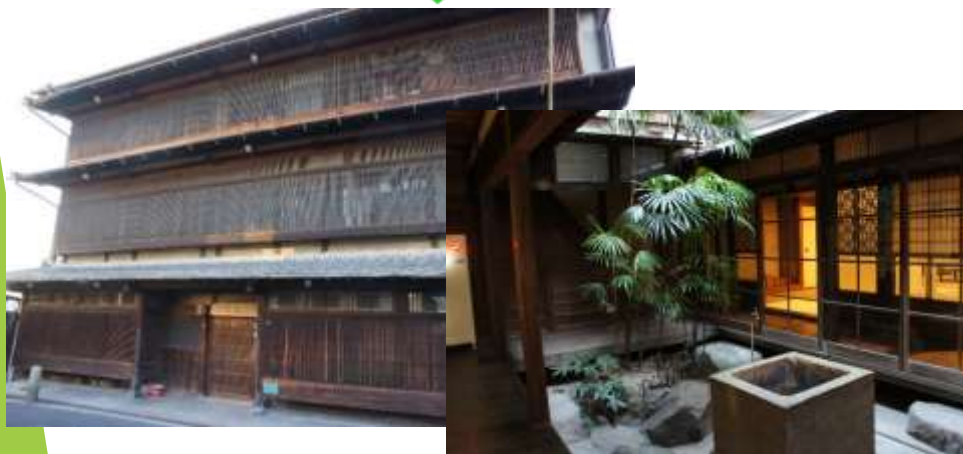
空き家リノベーションの成功例