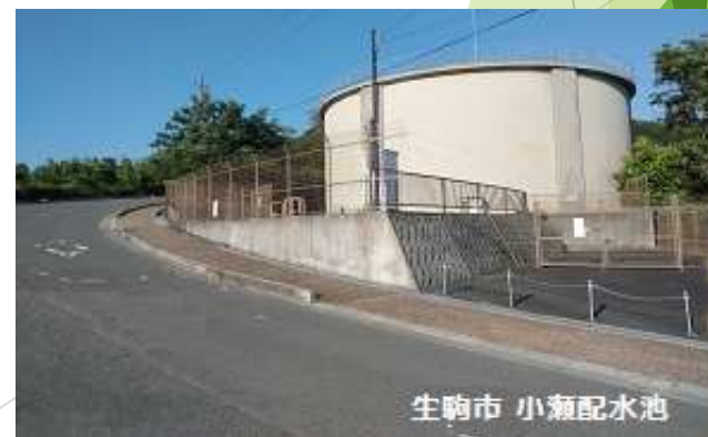
生駒市 小瀬配水池