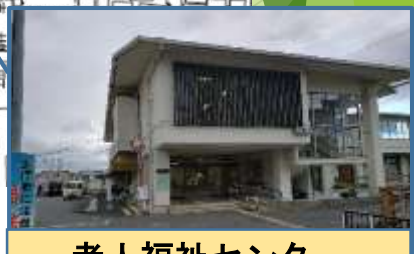
老人福祉センター (ゆたんぼ)