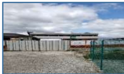
旧郡山保健所跡地