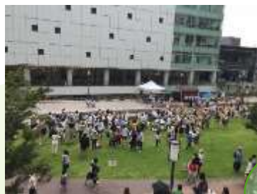
駅周辺に人が集まる仕掛けづくり