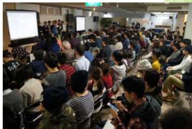
リノベーションスクールの様子