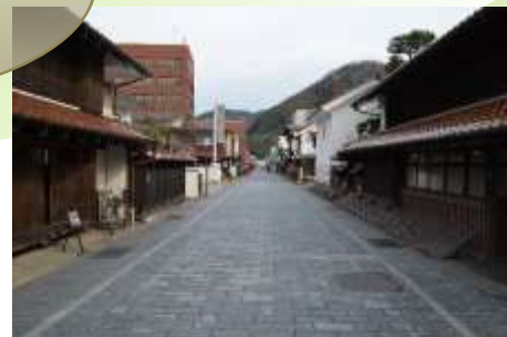
安全安心に歩ける環境づくり