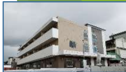
郡山西保育園 母子生活支援施設併設