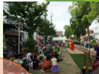
官民連携のまちづくり