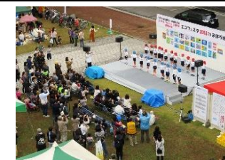
エコフェスタ in まほろば

橿原市を中心に、啓発イベント「エコフェスタ in まほろば」の開催や省エネ啓発のティッシュ配り、清掃活動、古代植物の植栽など、様々な啓発活動を通じて、地球温暖化防止に貢献されている。