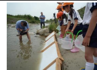
アユの放流（大和川）

毎年、地元幼稚園や保育園児を対象に、環境教育を目的に大和川にアユを放流するイベントを主催し、環境保全の大切さを伝えることで河川の美化に貢献されている。