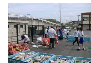
アルミ缶回収作業

奈良市月ヶ瀬地区において、生徒会が主体となり、長年（H6～）にわたって地域と協力しながらアルミ缶の回収活動を行い、ごみの資源化に貢献されている。なお、換金して得た収益は、車イス等の福祉機器の購入に充て、関係機関に寄付し続けている。