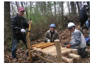
樹林の整備（イモ山公園）

生駒市のイモ山公園・真弓どんぐり公園を中心に、毎月、草刈りや倒木の整備、竹林の間伐等を行っている。また、里山体験など子どもたちへの環境教育にも取り組み、地域とのつながりを深めながら景観づくりに貢献されている。