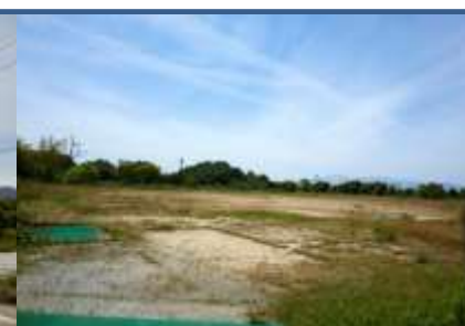
(敷地西側グラウンド部分)