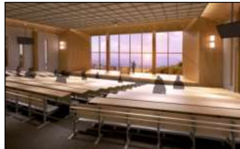
(セミナー・講座室: 学会、コンサートにも活用)