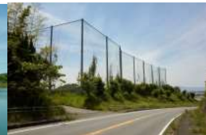
(北側道路からの眺め)