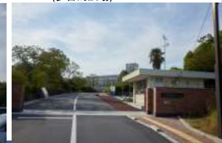
(隣接する奈良工業高等専門学校)