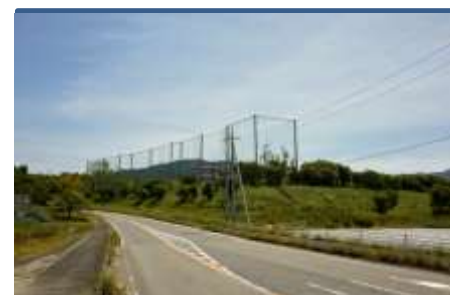
(西側道路からの眺め)