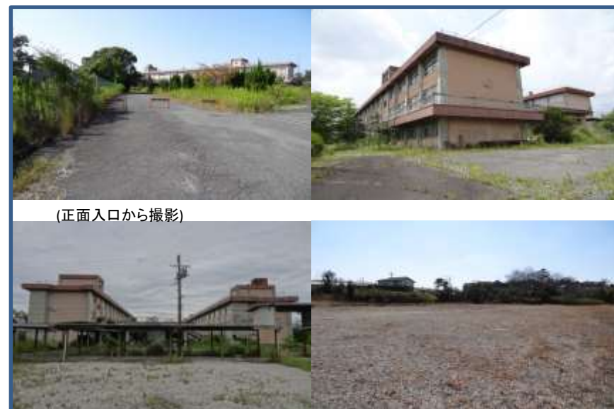
(正面入口から撮影)