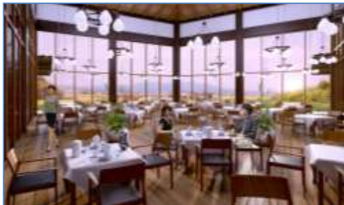
(レストランイメージ)