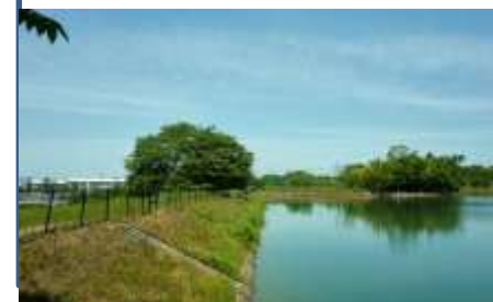
(南側の池対岸からの眺め)