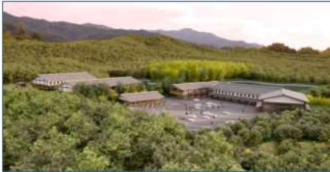
(候補地の例として、山麓をイメージ)