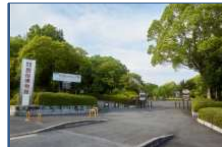
(民俗博物館正面入口)