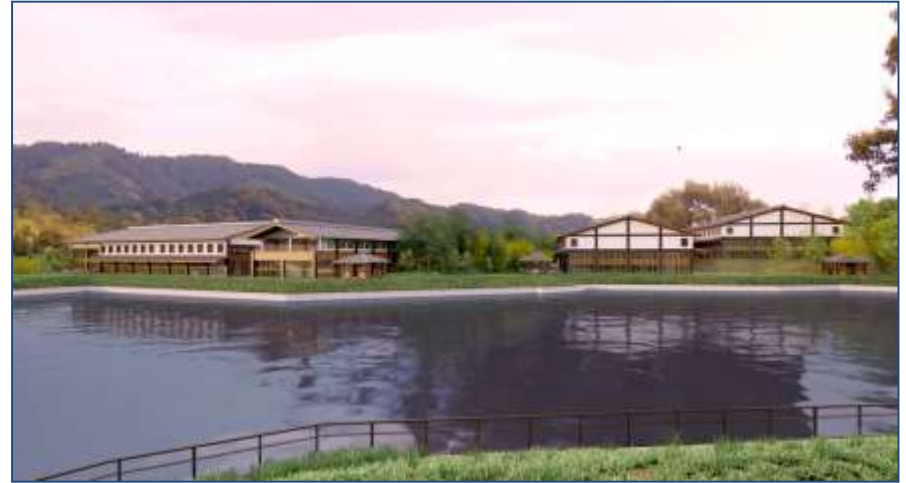
(池の畔に建つイメージ)