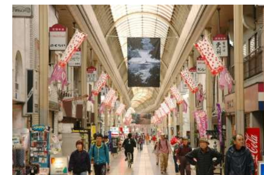
本通り商店街 大型タペストリー