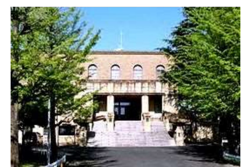
天理大学附属図書館