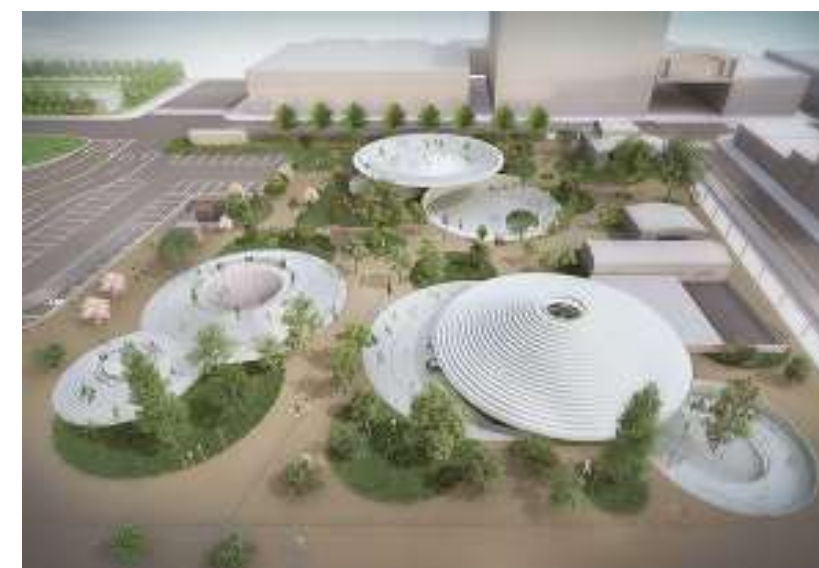
天理駅前デザイン空間