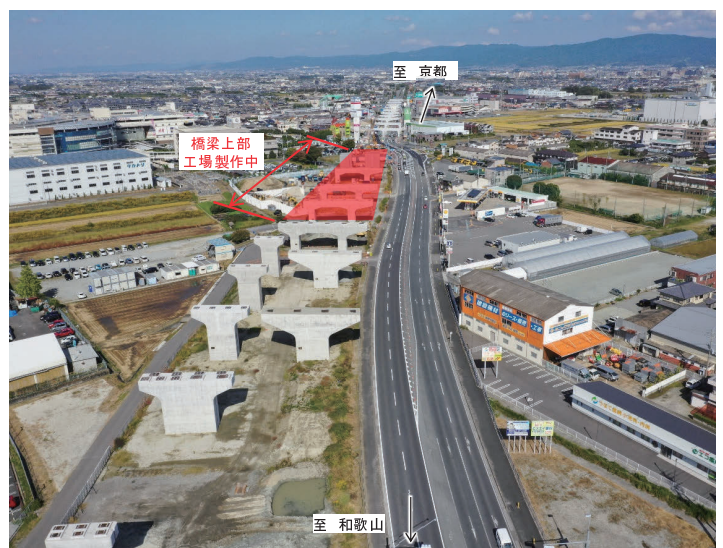
大和御所道路(橿原市新堂町)