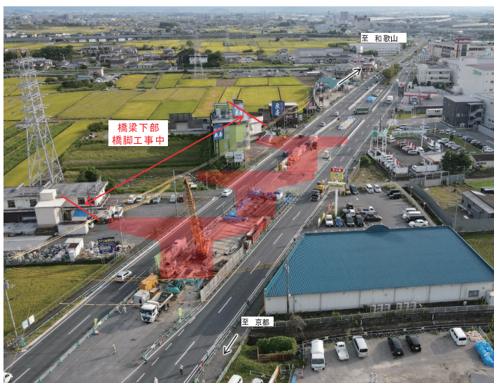
大和北道路(大和郡山市横田町)