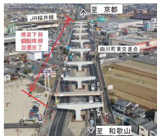
大和御所道路(橿原市曲川町)