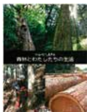
▲小学校5年生配布の副読本