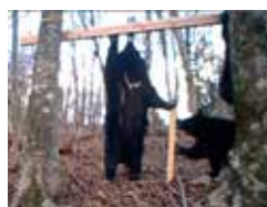
▲カメラトラップで撮影したクマの様子

森林をすみ処とする動植物の生態を見守りつつ、シカの防除や病害虫などによる森林被害を調査します。