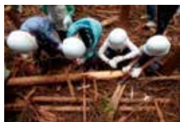
▲「森の学校」間伐体験

私たちの生活と森林との関係など、森林と環境について積極的に学ぶ機会を提供します。