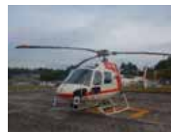
▲ヘリによるナラ枯れ被害調査