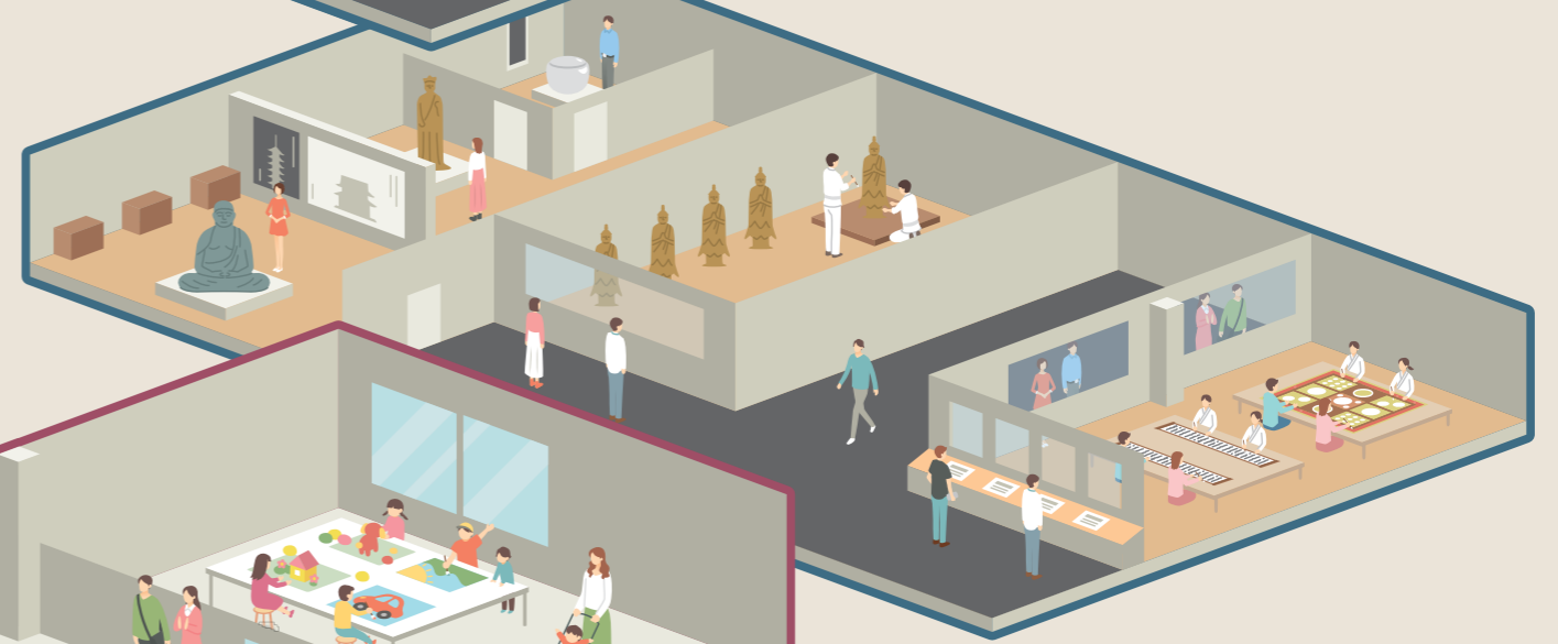
① 文化財修復・展示棟