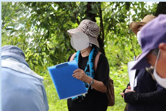
歴史ガイドボランティアからの説明