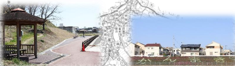
奈良の河川彩りづくり事業 滝川親水性護岸