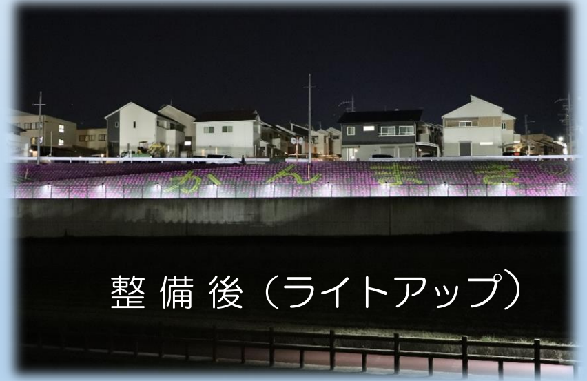
整備後（ライトアップ）