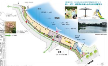
憩い・遊び・健康増進を 楽しむ公園整備