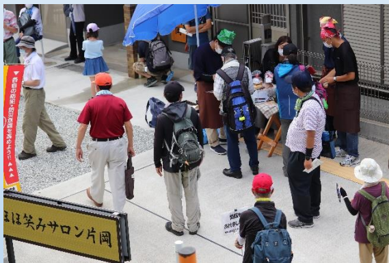
ほほ笑みサロン片岡にて休憩