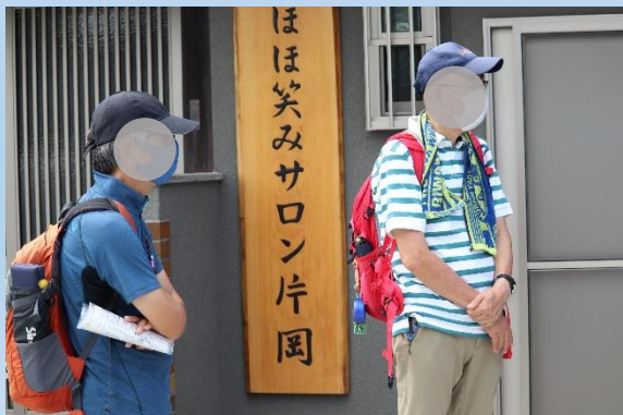
ほほ笑みサロン片岡