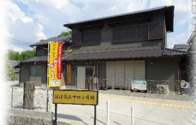
空き家活用モデル事業拠点整備 ほほ笑みサロン片岡