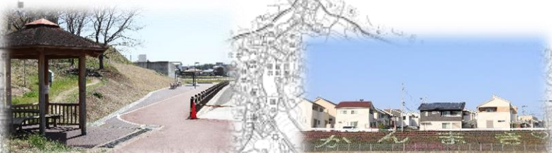
奈良の河川彩りづくり事業 滝川親水性護岸