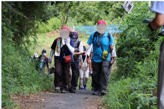
片岡城跡入口付近