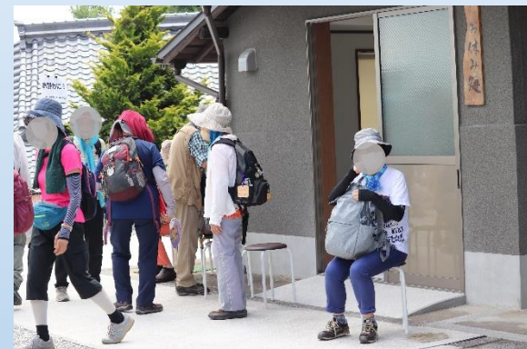
ほほ笑みサロン片岡にて休憩