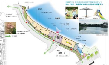
憩い・遊び・健康増進を 楽しむ公園整備