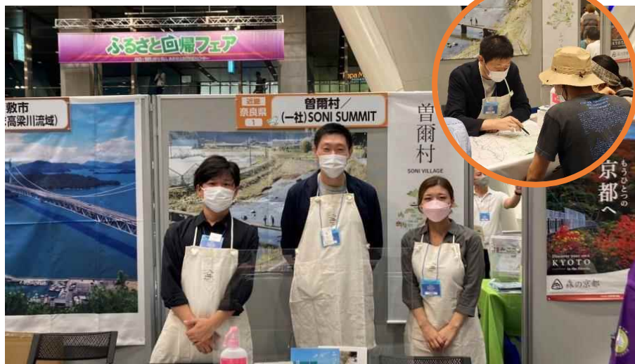
移住フェアへの出展