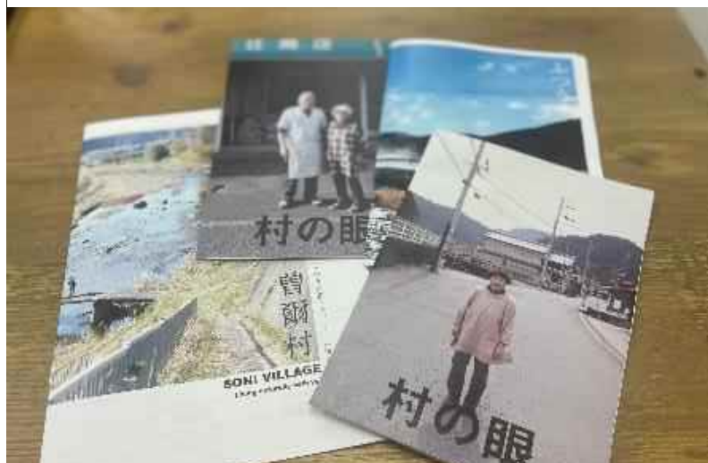
移住に関するパンフレットの作成