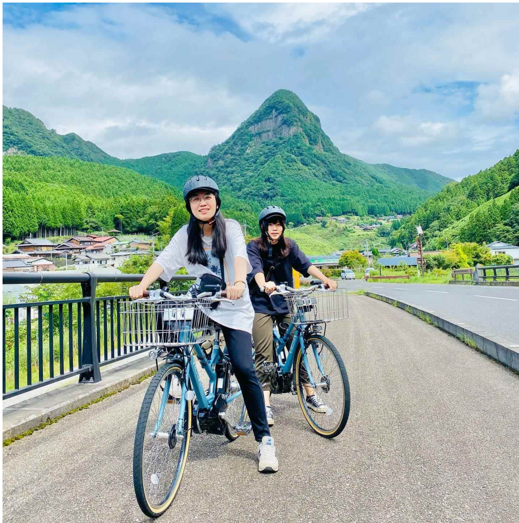
電動自転車のレンタサイクル事業「そにのわサイクリング」の 写真撮影