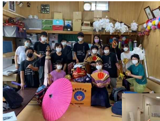
添上高等学校の学生たちと獅子小屋見学