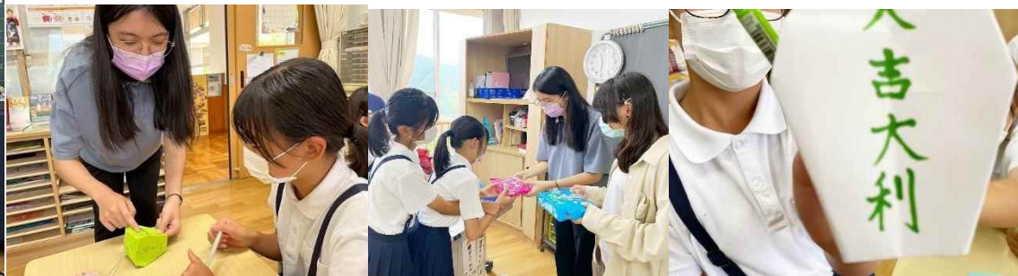
曾爾小中学校の生徒たちに、台湾文化交流ワークショップを開催。台湾語のレクチャー、台湾のお祭りランタンフェスティバルにちなんだ折り紙のランタンに台湾語で願いをかくなど。