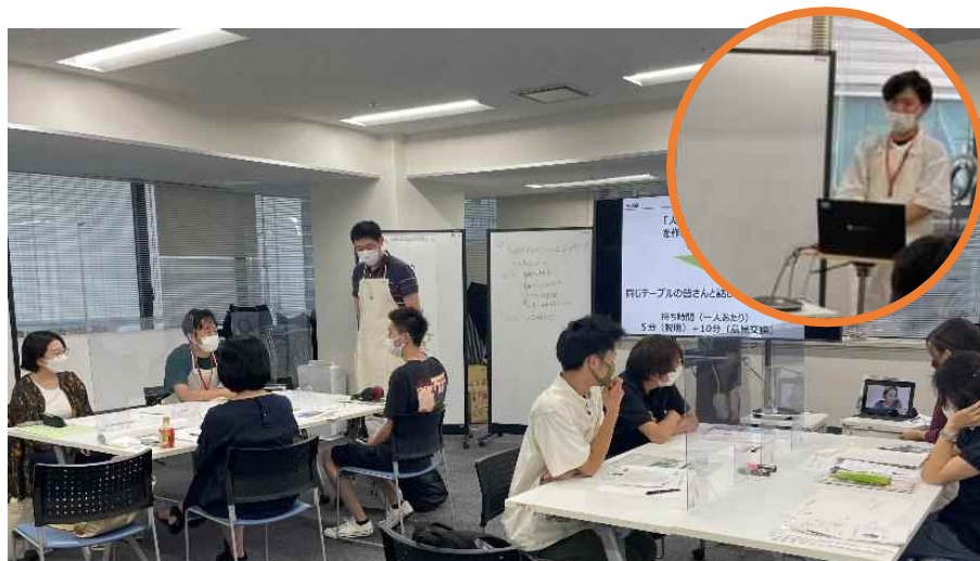
移住セミナーの実施