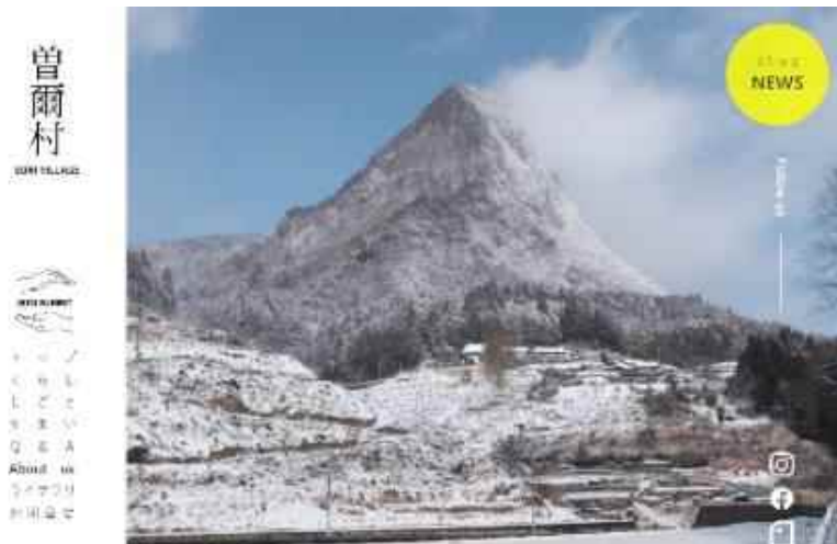
移住定住促進 Webサイトの作成・運用