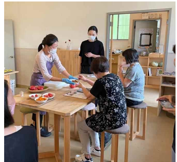
曾爾村産の野菜を使用した料理教室