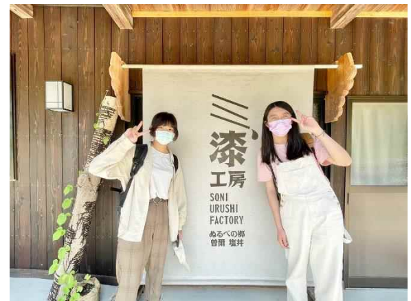
漆文化復興施設で漆を学ぶツアーの一場面