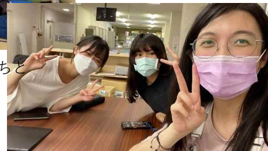
奈良教育大の学生と国際交流