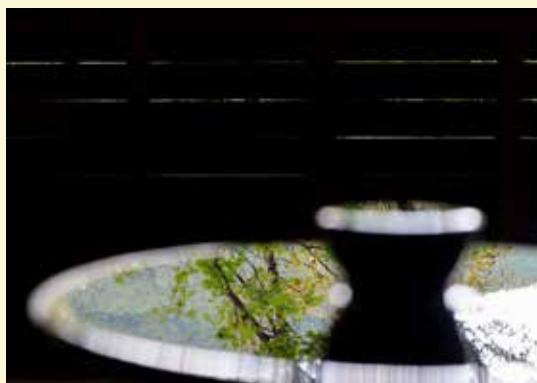
《うつしき - いけみず -》 上野千蔵 / Senzo Ueno