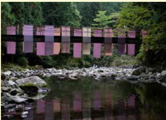
《うつしき - みずいろ -》 上野千蔵 / Senzo Ueno