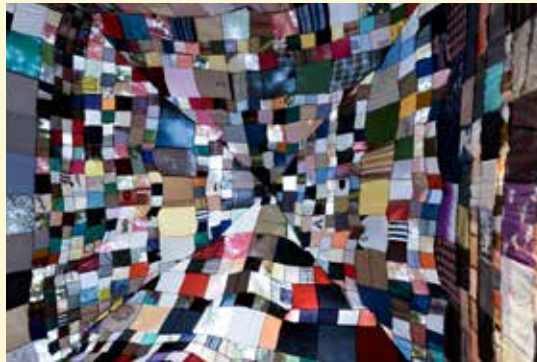
《人間の家》西尾美也 / Yoshinari Nishio