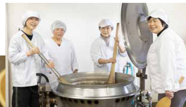
長野集落で栽培したこんにゃくで愛情込めて製品を作る《長野生産加工組合 びょうぶ 山桜の郷》の皆さん