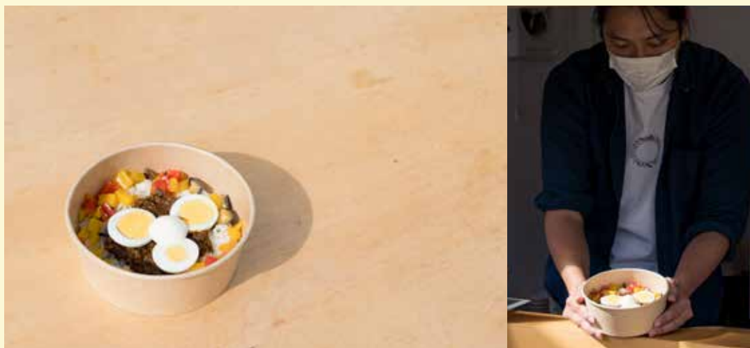
《口から出るもの、入るもの》 坂本大三郎 / Daizaburo Sakamoto