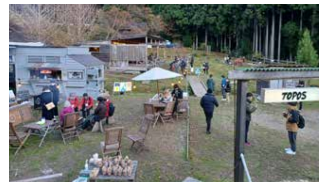
曾爾で開催された2021年 MIND TRAIL 奥大和 心のなかの美術館 クロージング会場の様子