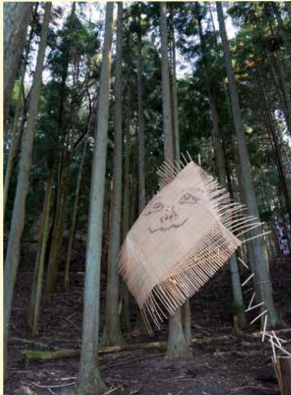
《吉野杉が住む空間に帰ってきた先人とともに子孫の成長を見上げてみる》 カ石咲 / Saki Chikaraishi