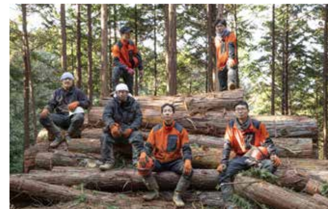
真摯に山に道を作り、木を育てている《豊永林業》社員の皆さん。若い力が活躍中