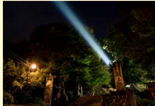
《JIKU #006 YOSHINO》 齋藤精一 / Seiichi Saito