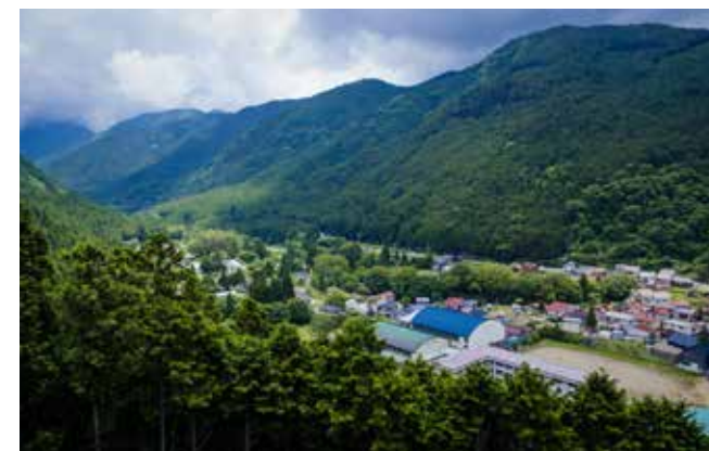
作品の展示会場の一つ《大原山展望台》。山々と調和した洞川温泉街の風景が広がる

名水豆腐 昔ながらの製法を守る豆腐店が村内に数店舗ある。ミネラルを含んだ伏流水の旨味を豆腐で体感。