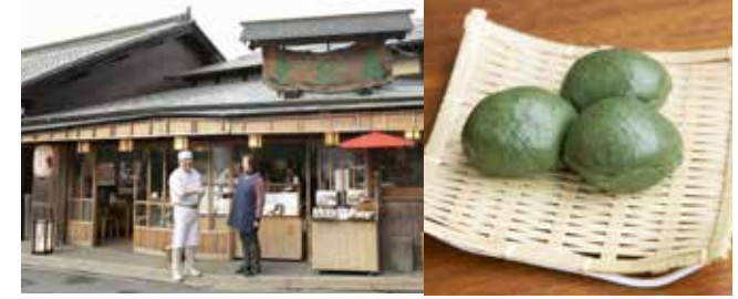
金峯山寺仁王門前に店を構え、草餅が名物 《御菓子司 萬松堂》の橋本さんご夫婦

奈良在住作家の小物販売のほか、カフェでは葛餅スイーツや大和ほうじ茶が味わえる。吉野町吉野山 950