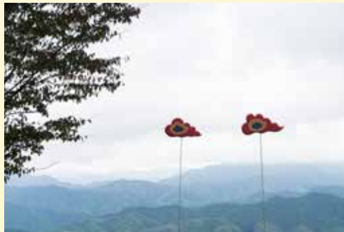
《1/8000000》 西岡潔 / Kiyoshi Nishioka