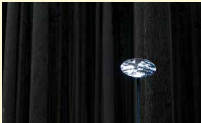
《白いカラス》 野沢裕 / Yutaka Nozawa