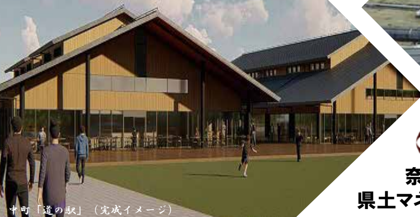
中町「道の駅」(完成イメージ)