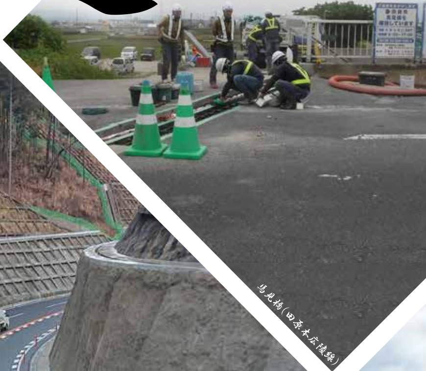
馬見橋(田原本広陵駅)