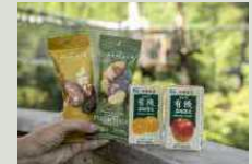
ネットの高さは4~12m。展望スペースからは十津川の山絶景が楽しめる。途中には休憩スペースや無料のドリンク、スナックの販売も。時間無制限なので1日中遊べるのも嬉しい。

木々の間に張られたネットの上で空中散歩が楽しめる「空中の村」。フランス出身のジョランさんが、自国で学んだ森の活用法を広めたいと設計段階から携わり2020年にオープンした。大自然の中で癒しの時間が過ごせると評判だ。