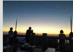
大台ヶ原の夕景や星空、早朝など、普段なかなか見ることができない時間帯のガイドも。利用者のニーズやレベルに合わせた登山コースをオススメしてくれる。