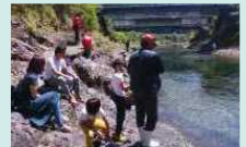
村で開催されたアマゴ釣り教室では多くの親子連れが参加し、清流での釣りや川遊びを楽しんだ。イベントの情報はHPやSNSでご確認ください。