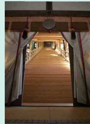
丹生川上神社下社

水の神、竜神を祀る神社で、本殿は県の指定重要文化財。平安時代には朝廷から雨乞いの使者が遣わされたといわれる。山中の溪流近くには竜神がすむと伝えられる穴があり、県内屈指のパワースポットとして知られている。 【所】宇陀市室生 1297