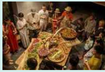
共通のロゴ入りTシャツを購入してもらい一体感を造成。清掃の時間以外に川遊びタイムもあり、終了後のパーティも楽しい。イベントは例年夏ごろ開催。詳細はHPやSNSでご確認ください。