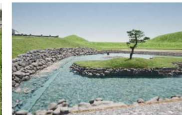
飛鳥京跡苑池南池整備イメージ