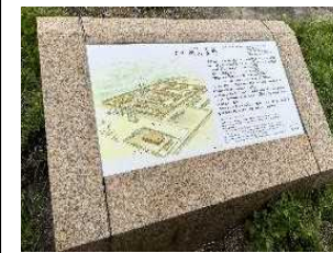
飛鳥宮跡 解説板更新

※貴重な流水施設が検出された飛鳥京跡苑池の北池部分については、基本設計の見直し後に工事着手予定。