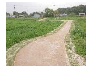
飛鳥宮跡見学ルート整備