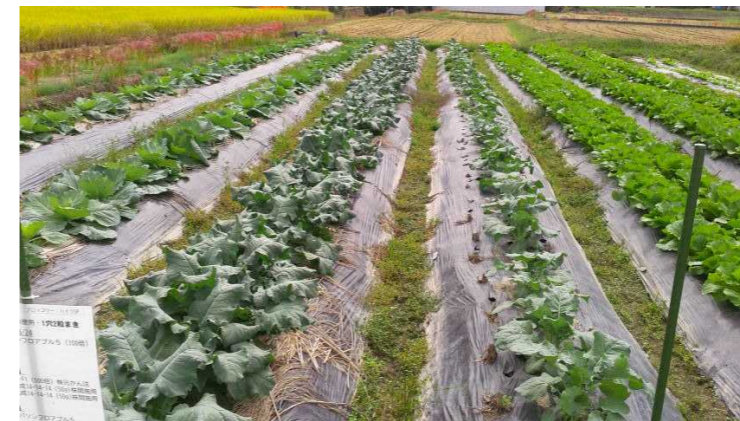
試験ほ場における栽培 (五條市・丹原地区)

【五條市丹原地区、広陵町百済川向地区、宇陀市伊那佐東部地区、田原本町法貴寺地区、平群町上庄・梨本地区、田原本町八田地区】