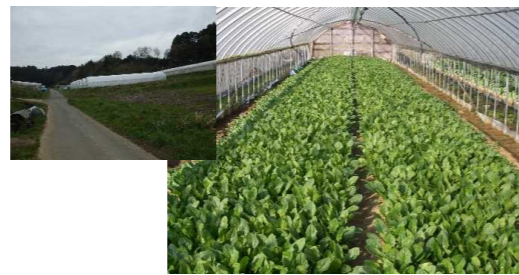
ホウレンソウ(大和高原南部地区)