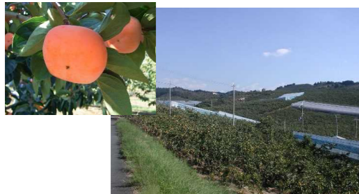
ハウス柿の栽培(五条吉野地区)