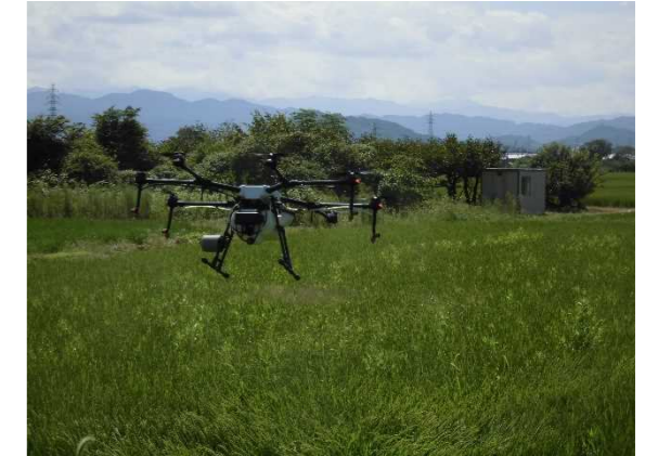
ドローンによる防除実験 (広陵町・百済川向地区)