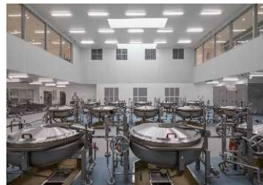
耐用年数を経過している 学校給食施設の割合