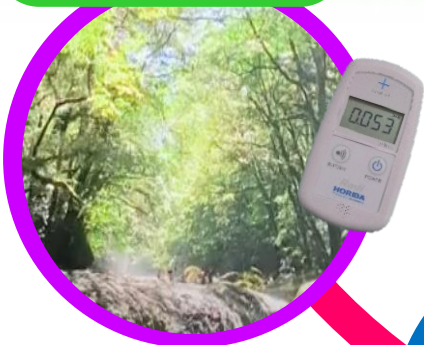
ガンマ線測定実験