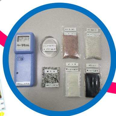
ベータ線測定実験