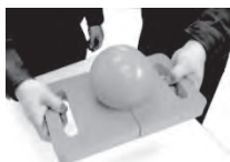
いっしょに玉はこび