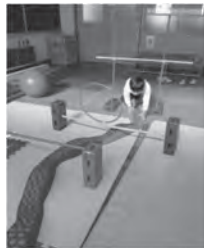
ウェイブバランス平均台