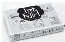
キャット&チョコレート