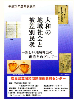
2016년도 전시 포스터

연구성과를 바탕으로 하여 주로 지역에 존재해 온 다양한 피차별민과 지역사회와의 관련 내용들을 일반인에게 전시, 공개하고 있습니다. 개별 테마에 초점을 맞춘 특별전도 수시로 개최하고 있습니다.