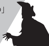
稗田阿礼 (ひえだのあれ)

私は記憶力がばつぐんの稗田阿礼。私が覚えていたことを太安万侶さんは『古事記』にまとめました。アイテムとは「もの」のこと。この部屋では、お話にでてくる「もの」について展示しています。さあ、がんばって問題にチャレンジしよう。