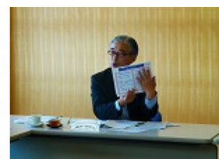
【高木先生からのご指導】