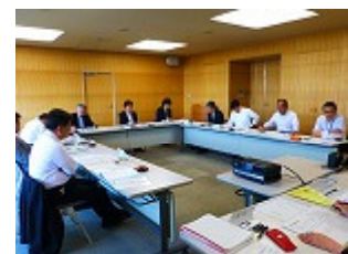
【モデル校情報交換Ⅱ】