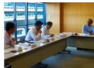
【モデル校情報交換Ⅰ】