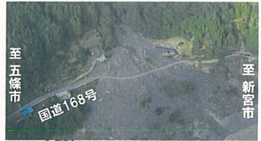
▲国道168号被災状況 (H23年9月時点)