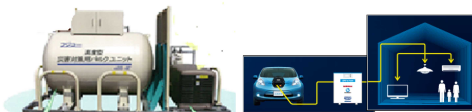
【LPガス発電等の自家発電設備の整備】 【EVからV2Hシステムにより家庭に電力を供給】

県立十津川高校でLPガス発電のモデル事業を実施。今後、市町村等の地域防災拠点等にも、国の補助制度を活用し、LPガス発電機やコージェネ等の自家発電設備の導入促進を図る。