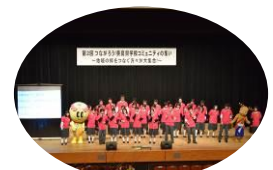
「上を向いて歩こう」 をみんなで歌おう！