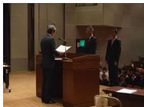
グッド・学校コミュニティ表彰 (大和高田市立片塩中学校)