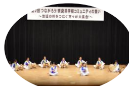
チャング演奏 (榛原西小学校)