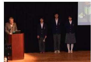
被表彰校の実践報告 (五條市立五條西中学校)