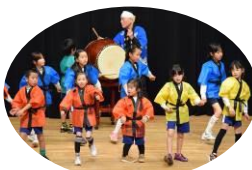
スンパ音頭 (真美ヶ丘東小学校)