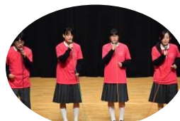
アカペラ部熱唱 (高田商業高等学校)