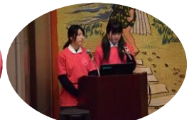
高校生ボランティア による司会 (高田商業高等学校)