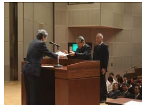
グッド・学校コミュニティ表彰 (明日香村学校・地域コミュニティ)