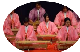
八雲琴演奏 (明日香村学校・地域コミュニティ)