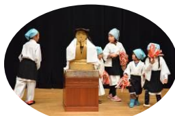
サンハライ法要 (登美ヶ丘北中学校区地域教育協議会)