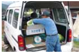
収穫した野菜を達人が直接学校に届ける