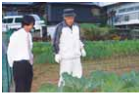
給食用に野菜を栽培・管理