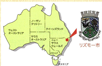
▲リズモー市の位置 (大和高田市役所HPより)