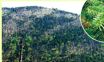
シラビソ林の縞枯れ(弥山)