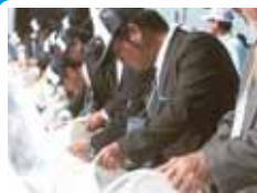
招待者による放流

豊かな海づくりのために功績の あった団体などの表彰、最優秀 作文の発表など。 ■16日(日) ■大淀町文化会館あらかし ホール(大淀町)