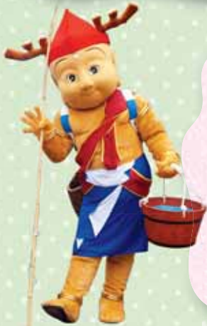
▲第34回全国豊かな海づくり大会コスチュームのせんとくん