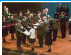
功績団体・コンクール入賞者の表彰