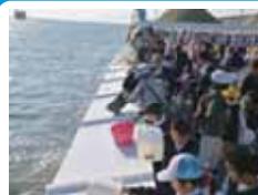
県民参加による放流

来賓や招待者によるアユ・アマゴ の放流、水上での歓迎行事など。 ■16日(日) ■おおたき龍神湖(川上村)