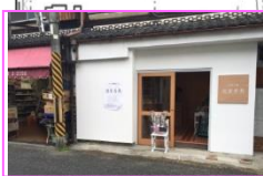
空き店舗を活用した実験店舗 「旬菜青果」 (H28年度実績)