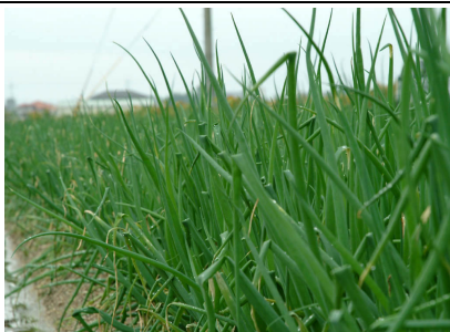
栽培中の結崎ネブカ