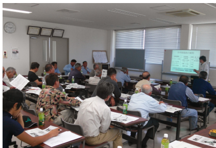
栽培講習会の様子