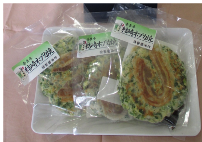
商品化されたお好み焼き「結崎ネブカ焼き」