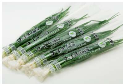
調製済みの市場向け商品