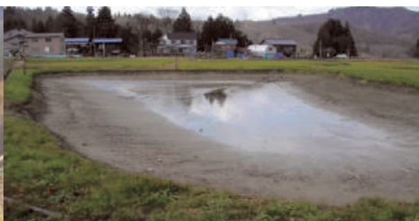
ため池の液状化被害