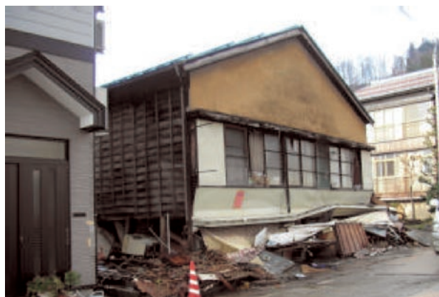
一階部分が押しつぶされた住宅の被害