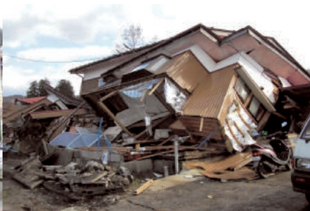
横倒しになった住宅の被害