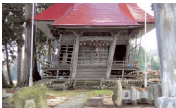
建物や石灯籠に被害を受けた神社