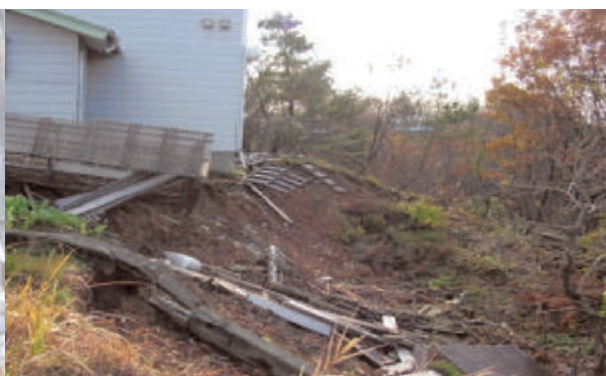
斜面に面した住宅の地盤被害