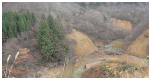
土砂崩れによる河道閉塞