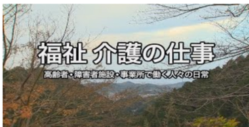
高齢者・障害者施設・事業所で働く人々の日常