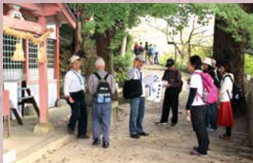
ボランティアガイドの話を聞く参加者の皆さん (10月24日 斑鳩町)