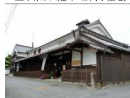
登録有形文化財「藤岡家住宅」

主催：NPO 法人うちのの館（やかた）、奈良県（なら・まちづくりコンシェルジュ）