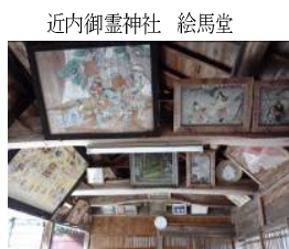
近内御霊神社 絵馬堂