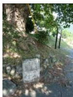
江戸時代の風景を残す道