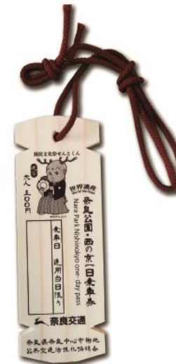
図. 木簡型一日乗車券