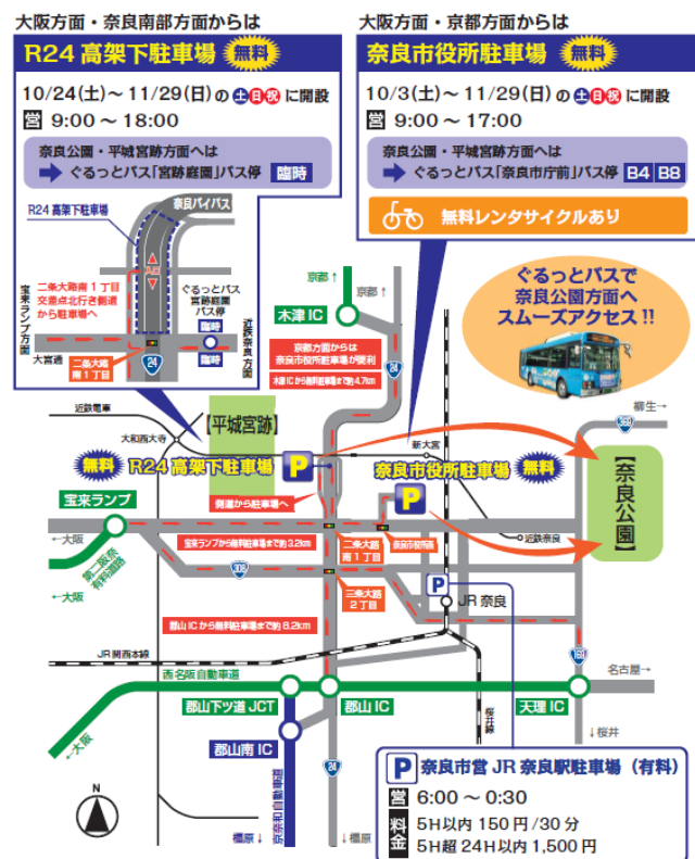
図. 平成28年度の実施概要（平成27年度と同様）