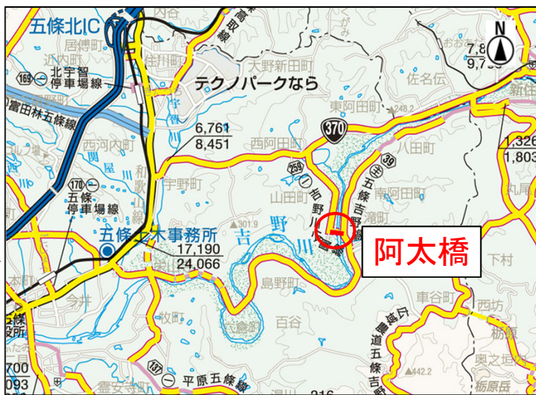
「奈良県道路網図(平20近使、第67号)を転載」