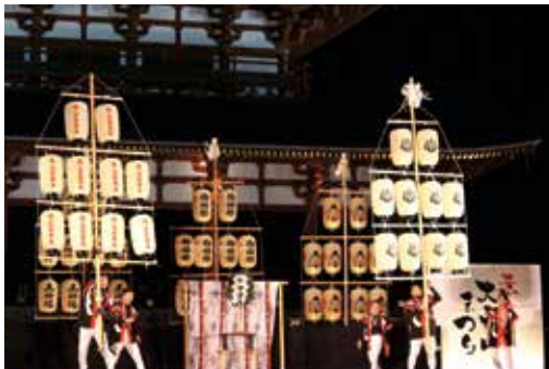
鴨都波神社のススキ提灯献灯行事

初日は、四天王をモチーフとした光り輝く大立山四基の点灯式に、荒井正吾奈良県知事や関係者が出席し