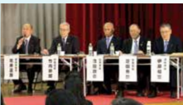
第4回では、宇陀市長、山添村長、曾爾村長、御杖村長が参加されました