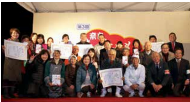
あったかもんグランプリ受賞者の高取町、安堵町、野迫川村、曽爾村、下北山村のみなさん

5日間を通じて、約5万人が来場しました。1月29日には、地域医療・介護の分野で地道な活動に取り組み、地域住民や関係者から高い評価を受けている方を表彰する「奈良のお薬師さん大賞」の授賞式も平城宮跡で行われ、左記の3人が受賞されました。