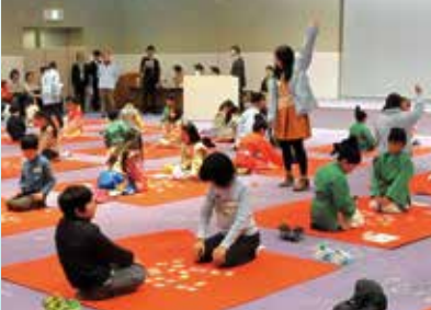
こども古事記かるた大会の様子