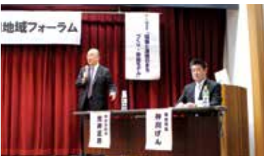
第3回では、奈良市長が参加されました

テーマ1では、地域包括ケアを充実させるためには、県や市、医師会、病院、保健師等と一緒に取り組んでいく必要があるなどの意見が、テーマ2では、地域の振興のためには、景観、スポーツ、食、泊などの地域資源の活用が重要であるなどの意見がありました。