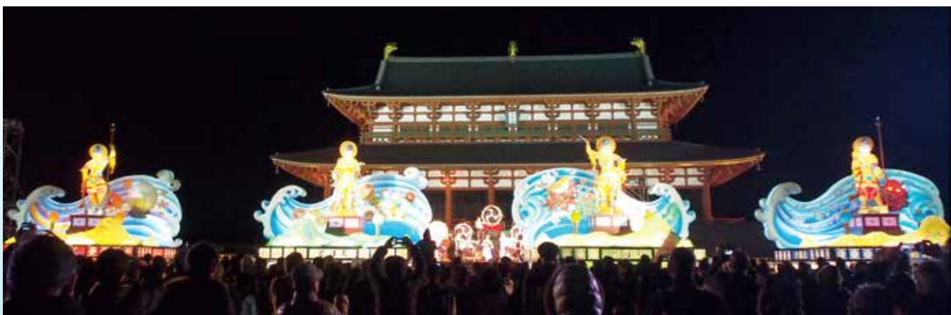
大極殿前で光り輝く四天王の大立山

問 奈良県冬季誘客イベント「大立山まつり」実行委員会(県観光プロモーション課内)