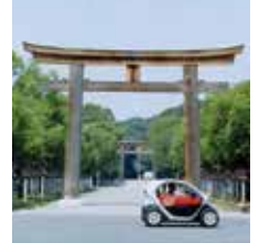
超小型モビリティ