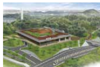
新沢千塚古墳群公園の整備(イメージ)