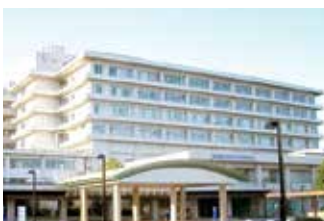
県立医科大学附属病院