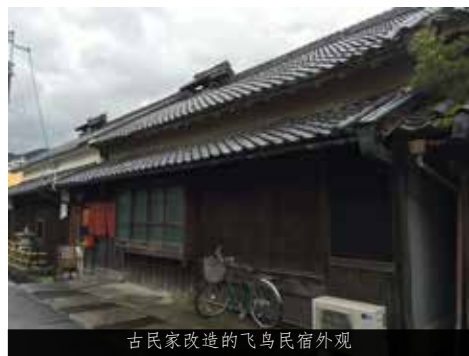
古民家改造的飞鸟民宿外观