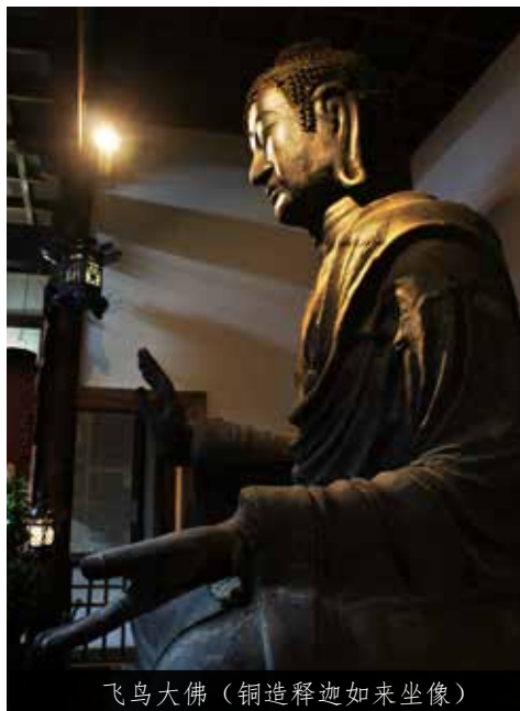
飞鸟大佛（铜造释迦如来坐像）

没有本堂、火灾损毁的艰辛时代，1400年间直至今日一直屹立于此。虽各处有些损伤，但1400年间佛像从诞生之日起就屹立在同一地方，真是一大奇迹。在古代，推古天皇和圣德太子想必也在佛像面前虔诚地合掌膜拜呢吧。