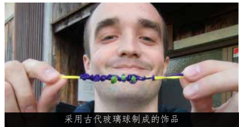
采用古代玻璃球制成的饰品

古代玻璃球制作体验 HP: http://asukakyo.jp/garasu/