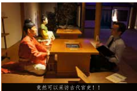
竟然可以采访古代官吏！！

一楼展厅里主要展示着日本绘画，每隔一段时间会更换画展。此外，地下一层还展有挖掘调查中出土的货币；飞鸟时代人们的服装以及生活场景也得以再现；您还可以使用触摸屏，采访古时官吏，了解古时生活；另外，万叶歌体验角通过各种演绎方式生动地将万叶歌与我们的生活联系起来，妙趣横生，不容错过。在这里通过视觉、触觉等可以感受到日本建设国家之时的状态，获得多方位体验和刺激，敬请参观。