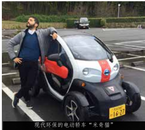
现代环保的电动轿车“米奇猫”

从近铁飞鸟站下车后，就可以看到停靠在站前的圆圆的可爱的米奇猫，等待着游客租借。只要您有日本的驾照，办理简单的手续即刻启程。可以二人同乘，推荐情侣夫妻乘坐哦。