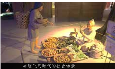
再现飞鸟时代的社会场景

奈良县立万叶文化馆位于明日香村的北部。该馆展示着日本最古老的歌集《万叶集》的相关历史资料，此外还栩栩如生地再现飞鸟时代人们的日常生活场景。对于历史迷来说探访这里尤有意义。