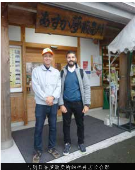
与明日香梦贩卖所的福井店长合影

副店长跟我说，“这里还有好吃的水果，买完后可以在店里立即品尝，如果您有不了解的的商品的话，我们会用英语热情地解答，恭候大家的光临啊。”