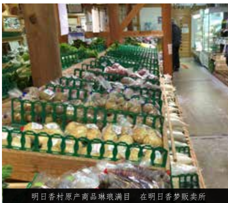
明日香村原产商品琳琅满目 在明日香梦贩卖所