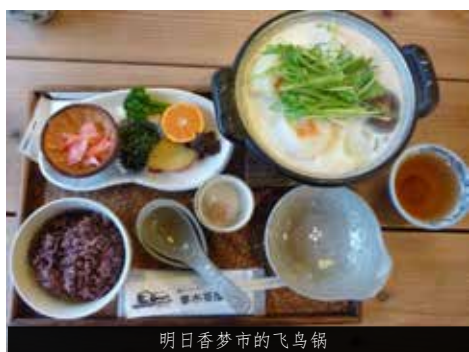
明日香梦市的飞鸟锅

该店位于石舞台附近，里面出售明日香村村民制作的陶器、古代玻璃首饰、书签等装饰品，深受外国游客喜爱。