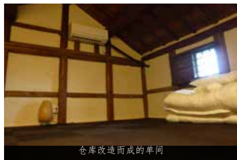
仓库改造而成的单间