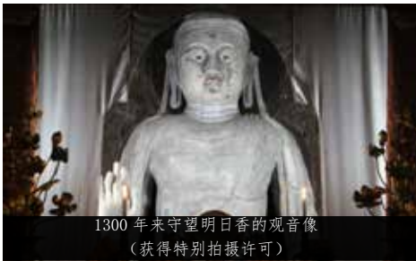
1300 年来守望明日香的观音像 (获得特别拍摄许可)

此外，冈寺还有英文和中文等外语说明册，十分便利。副住持介绍说，“这里洋溢着日本独特的氛围，同时还留有飞鸟时代西洋文化通过丝绸之路传到日本时文化传承的余韵，诚挚欢迎海外朋友前来参观。”