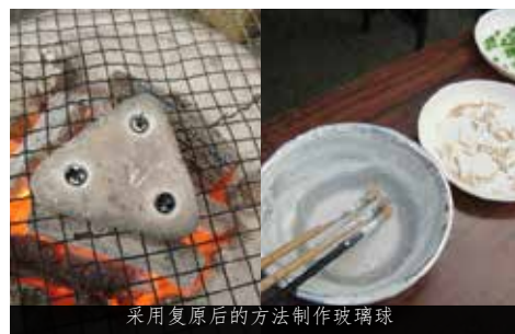
采用复原后的方法制作玻璃球

关于飞鸟时代日常生活的古书鲜有流传，现代人获得的知识多从发掘调查中获得。明日香的古代玻璃体验项目也是从发掘调查中获得的灵感。 根据手艺人介绍，玻璃球是飞鸟时代人们的装饰品，从遗迹中出土了制作玻璃球的原料、工具以及炉子，为了重现传统技法，根据实验考古学成功复原了制作工艺。这家工房成立的目的是为了到访的人们能够体验到飞鸟时代的玻璃球工艺。如今，每年都有 300 多人前来体验，不少外国朋友一边请用