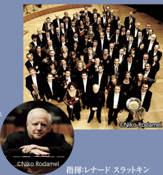
指揮: レナード スラトキン

■ 会場: 県文化会館 国際ホール ベートーヴェン/エグmontより序曲 ラヴェル/スペイン狂詩曲 ラヴェル/ダフニスとクロエ組曲2番 ムソルグスキー(ラヴェル編)/ 組曲「展覧会の絵」