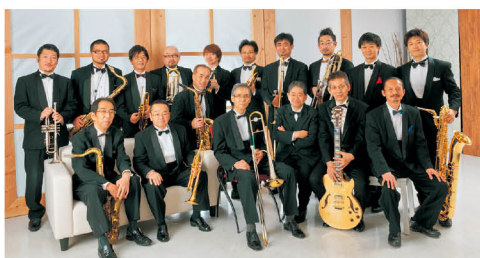
アロージャズオーケストラ