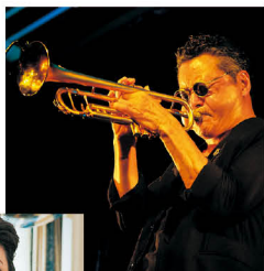
日野皓正 (トランペット)