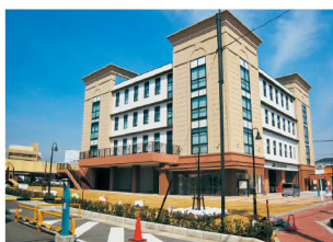
市民交流センター