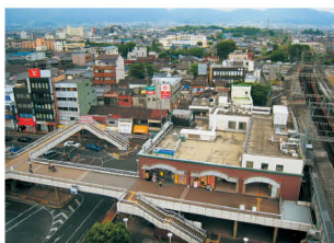
近鉄大和高田駅周辺