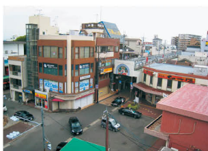
近鉄高田市駅周辺