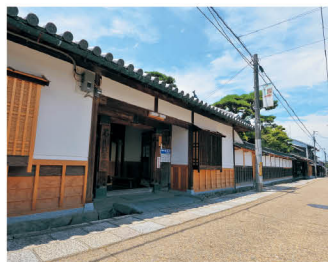
土佐街道の街なみ

かつて高取の城 下町は、高取山 上の城へと続く 大手道沿いに展 開しており、町家 の景観がよく 残っています。周 辺自治会では、 「土佐街道周辺 景観住民協定」を 締結し、城下町の景観が色濃く残る 土佐街道周辺の街なみを保全し次世 代へ継承していくため、住民一人ひと りが取り組みを進めています。