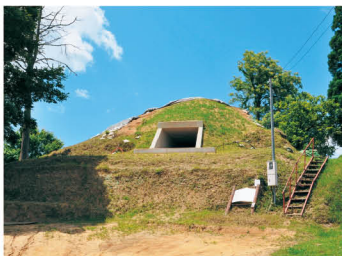
与楽カンジョ古墳