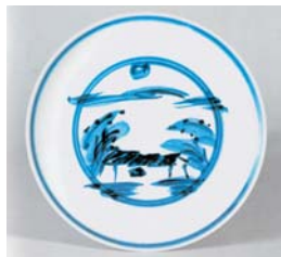
磁器染付竹林月夜模様 皿 当館蔵

※65歳以上の人、身体障害者手帳・療育手帳・精神障害者保健福祉手帳をお持ちの人と介助の人1人、外国人観光客(長期滞在者・留学生含む)と付き添いの観光ボランティアガイドの人は無料。ほか詳しくは上記HPで。