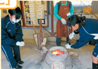
古代ガラス制作体験の様子

奈良の社寺や地場産業、観光についてなど、生徒たちは自身でテーマを設定し、現地でのフィールドワークや発表などの探求学習を行います。この授業を通して、郷土への関心や理解を深めます。