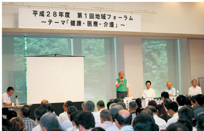
第1回では、榎原市長、高取町長、明日香村長が参加しました。

基調講演では、「地域医療構想と地域包括ケアシステム」と題して、今川院長が、地域中核病院として