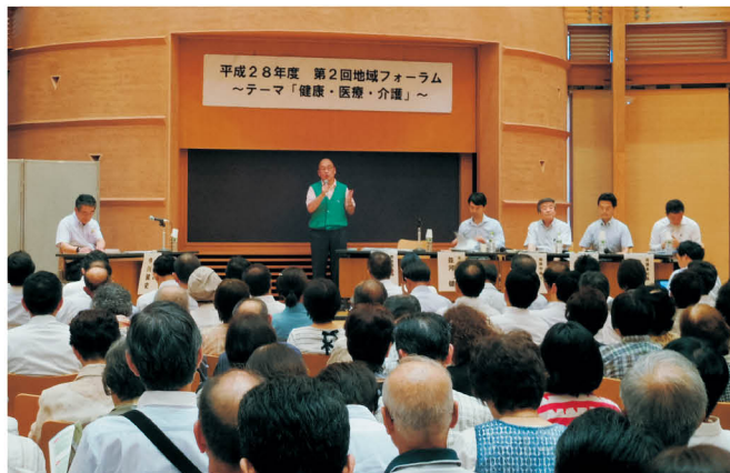
第2回では、天理市長、桜井市長、川西町長、田原本町長が参加しました。

の地域医療構想への取り組みなどについて講演しました。 また、引き続き行われたパネルディスカッションにおいて、第1回では、がん検診の受診など予防医学の重要性や、地域包括ケアを進めていくためには多職種連携が大事などの意見が、第2回では、奈良県の取り組みは全国的にも注目されており、奈良モデルのスキームを活用して、医療と介護の連携を進めていくことが重要などの意見がありました。