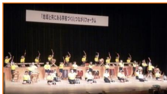
心を一つに和太鼓演奏「鎮主の森」 （橿原市立新沢小学校）