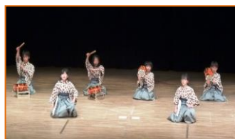
川西子ども能楽メンバーによる舞囃子 （川西町立川西小学校）