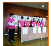
畝傍高校ボランティア生徒による受付