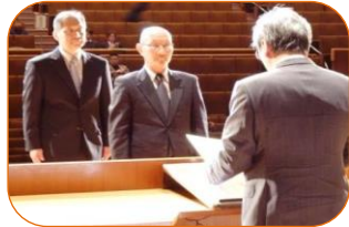
（平和小学校コミュニティ）