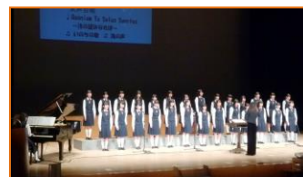
女声合唱「花は咲く」他 （畝傍高校音楽部）