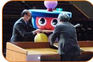
（五條小学校コミュニティ協議会）