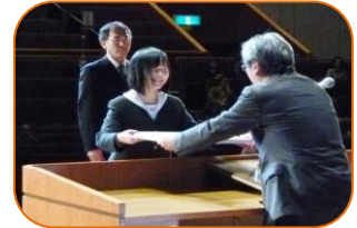
（県立榛生昇陽高等学校）

※上記の 3 団体は、「平成 28 年度『地域学校協働活動』推進に係る文部科学大臣表彰」も受賞