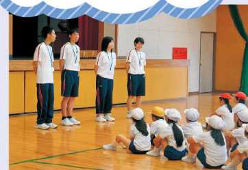
小学校体験実習のようす